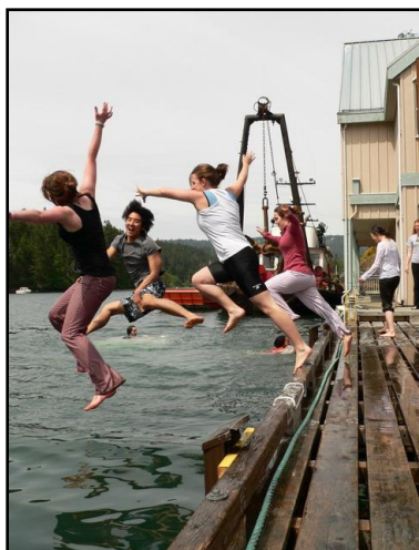
Ugrás a 8°C-os szabadságba az IB vizsgák befejeztével...

távrolról segítettek az elmúlt két év során: barátaimnak szerte a világban; családomnak, tanárainak; a szünetekben vendégül látó host familyknek; azoknak, akik adományaikkal évről évre újra lehetővé teszik az iskolák működését; és végül, de nem utolsósorban az EVIME tagjainak, akik áldozatos munkája révén mindezt megtapasztalhattam.