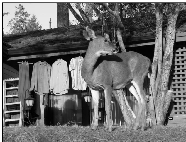
Kampuszon legelésző őz, háttérben az egyik tanár száradó ruháival

Majd' két évet eltöltve ezen a mesebeli helyen biztosan állíthatom, hogy ez az idő nem volt elég arra, hogy a hely varázsával beteljek. Az erdő és a tenger nyugalmat árasztó (vagy éppen igencsak viharos) szépsége megteremtett számomra egy az alaphangulatot, amelyben mindig otthon éreztem magam. Ez inspirált arra is, a kampusz természeti környezettel szorosan összefonódó építészettel válasszam műalkotásaim és az Extended Essay témájául. Mindennapjaim részei voltak a Pedder Bayt mindig új, addig nem látott színpompába öltöztető napfelkelték, melyeket a tengerre néző ebédlőből néztem korán kelő barátaimmal. Az erdőben tett csoportos vagy éppen magányos séták mindig az iskolai élet terheitől való elszabadulást, testem és lelkem felfrissítését jelentették.