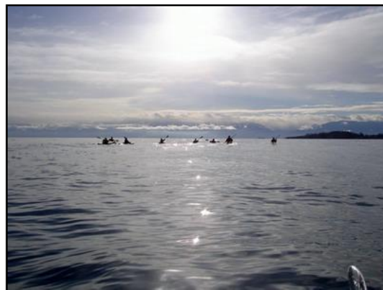
Kajak túra 2006 őszén a Juan de Fuca-szorosban

Könnyű lenne azt mondani, hogy a két év „rengeteget változtatott” rajtam. Emlékszem azonban, amikor egy barátom úgy fogalmazta meg a college hatását magára nézve, hogy az ott töltött hónapok addig bezárt kapukat nyitottak meg benne. Magam is így érzem. Nem az iskola falai között ébredtem rá a nemzetközi egyetértés és tolerancia fontosságára, de arra annál inkább, hogy ezek és sok más hasonló érték a való életben hogyan nyilvánulnak meg. A két év maga is egy Kapu a világra, mely úgy érzem kitarult előttem sokszínűségével, értékeivel, konfliktusaival, és legfőképpen arcaival, azok személyében, akiket megismertem.