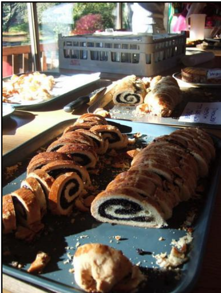
Mákos beigli, amit a European National Dayre sütöttem :)

Ha megpróbálnám lefesteni az iskolabeli élet hétköznapijait, akkor egy mozgalmas színekavalkád lenne az eredmény. Számomra az egyik legnagyobb kihívás a káoszban a rend megtalálása volt: a tanulás, a CAS foglalkozások, a társasági élet, szórakozás, pihenés és alvás kiegyensúlyozása, miközben sosem elég az idő egyikre sem!)