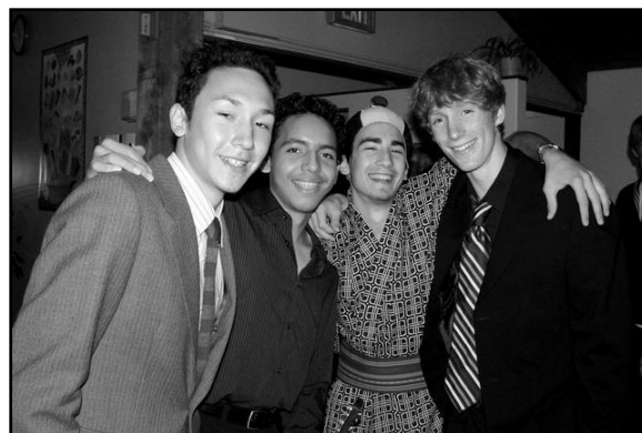
Szobatársaim a második évben: East House, Room 7.

számos önértékelési válságon. Sokat tanultam az előítéletek félretételéről, az egymás iránti bizalomról és őszinteségről. Szerető és támogató emberekkel körülvéve, de mégis függetlenül élve sokat fejlődött önállóságom. Önmagam mélyebb megismerésében és elfogadásában rengeteg segítséget jelentettek azok a most már életre szóló barátságok, amelyek a két év alatt formálódtak. Barátaim szeretete, törődése, hűsége és a megannyi együtt átélt élmény az, amire legfontosabbként tekintek vissza.