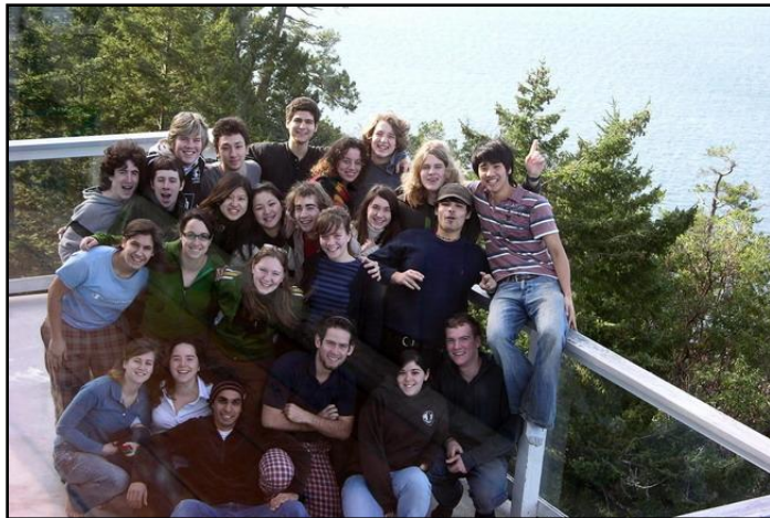
Pender Island, Southern Gulf Islands. A Victoriától nem messze fekvő szigeten, egy körpanorámás házban töltöttük 20-25en a tavaszi szünetet.

A college buborékjában való életre jellemző önmagunk megkérdőjelezése, nemcsak érzelmi szempontból, hanem hogy van-e értelme a sokszor elérhetetlennek látszó „UWC eszmék” teljesítésére való törekvésnek. Vagy hogy egyáltalán mit is értünk ezek alatt... Pearsonból elballagva úgy érzem, hogy a mozgalmat illető kritika és viták elkerülhetetlenül részei, sőt lételemei a UWC-tapasztalatnak. Mert bár a két év mindenki számára máshogy telik, senki sem kerül ki belőle átalakulás nélkül. A lecke mindenki számára más, és a távozó másodévesek nem kapnak írásos formában kézhez egy használati utasítást a világ jobbá tételéhez - mert az saját magukban rejlik. A Pearson College és tágabban az Egyesült Világkollégiumok megtapasztalásának számomra egyik legnagyobb értéke, hogy segít megtalálni a kulcsot önmagunkhoz és kiaknázásra váró lehetőségeinkhez.