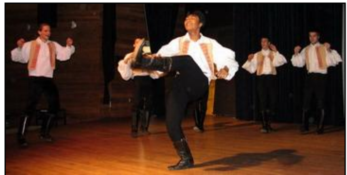
Kalotaszegi legényes tánc, melyet az egy angoltanár tanított be meg nekem is és amit a „One World” show keretében adtunk elő Victoriában