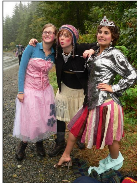
Egyesek így túrznak...

Pearson a személyiségem fejlődése és emberi kapcsolataim alakulása szempontjából is fontos állomás volt. Egyrészt átéltem a családtól és a tágabb értelemben vett otthonomtól való elszakadást, amelyet a hovatartozás hiányának érzése kísért. Az iskola alapjáraton intenzív, stresszel teli légkörében estem át