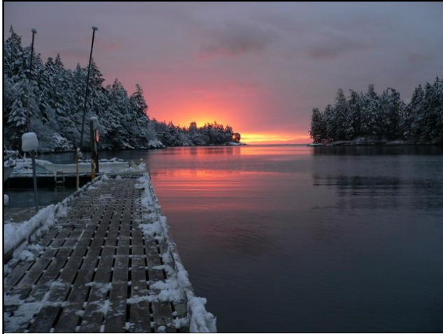
Tűzes napfelkelte a havas öbölben. Az amúgy igen ritka hóesésből 2006 őszén igencsak kijutott: egy hóvihár miatt három napig nem volt áram a collegeban...

Ha megpróbálnám lefesteni az iskolabeli élet hétköznapijait, akkor egy mozgalmas színekavalkád lenne az eredmény. Számomra az egyik legnagyobb kihívás a káoszban a rend megtalálása volt: a tanulás, a CAS foglalkozások, a társasági élet, szórakozás, pihenés és alvás kiegyensúlyozása, miközben sosem elég az idő egyikre sem!)