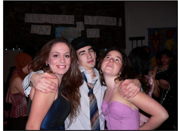
„Team Art” - két „művésztársammal” az European National Day díszvacsoráján